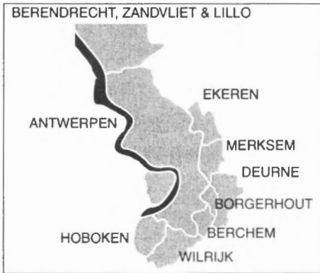
Figuur 1 : Kaart van de Antwerpse districten