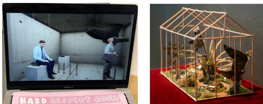
Figuur 4 Verbeeldingen van het lerarentekort: van 'hard' naar 'soft' respect

De verbeeldingen van het lerarentekort vervulden na afronding van het onderzoek door de studenten een rol in ex-ante onderwijsbeleidsprocessen. In een publicatie (De Vries et al., 2023) zijn de verbeeldingen gedeeld met het publiek (onder andere leraren, schoolleiders) om tot dialoog over schoolspecifieke aanpakken aan te zetten. Met OCenW wordt verkend hoe de verbeeldingen zouden kunnen worden meegenomen in voorbereidende gesprekken over regio-aanpakken, eveneens om de dialoog over de problematiek vanuit nieuwe invalshoeken te voeden.